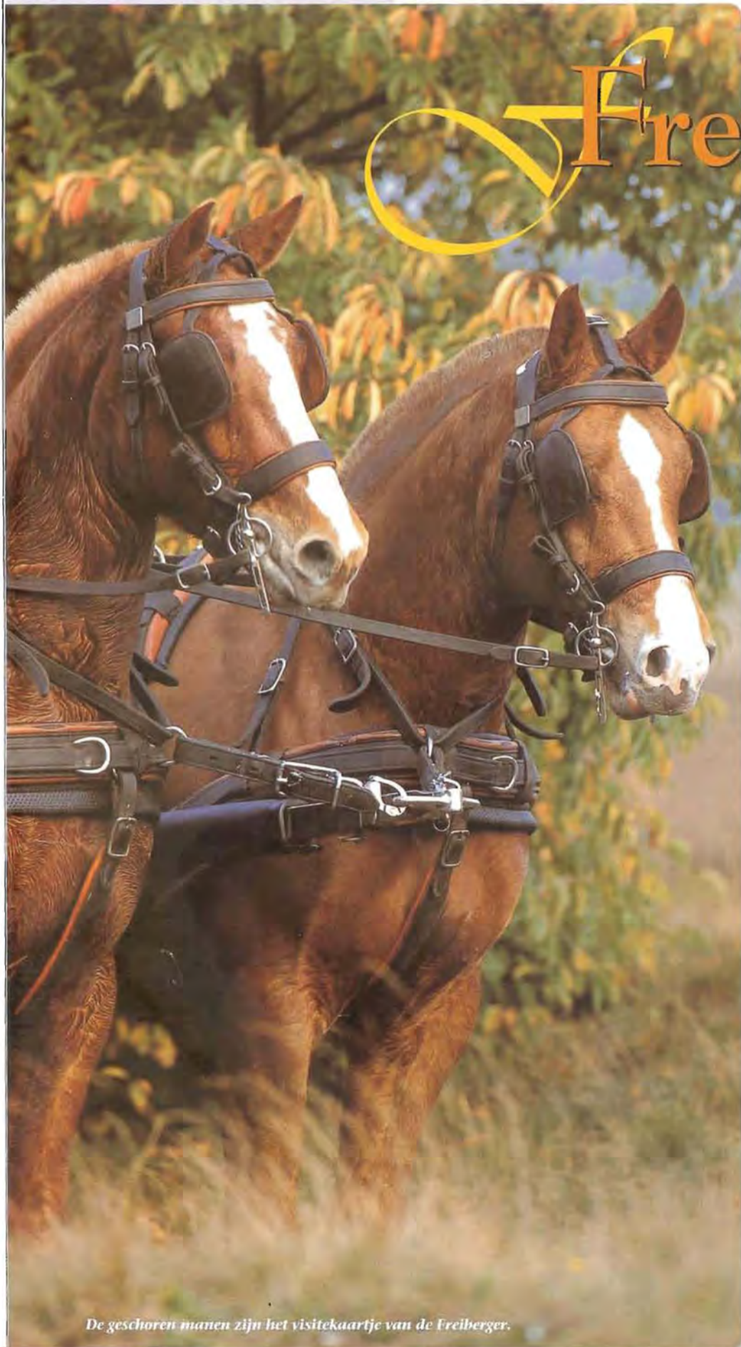
De geschoren manen zijn het visitekaartje van de Freiberger.